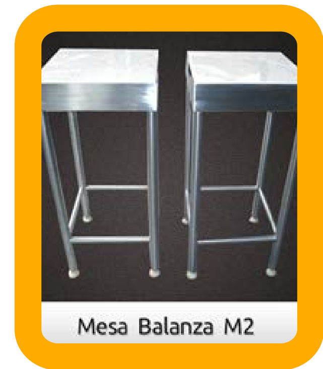
Mesa Balanza M2

Manufactura sanitaria con acabado satinado. Fabricación en acero inoxidable para una limpieza fácil. Entrepaño de lámina de acero inoxidable (opcional, rodajas de poliuretano (opcional) y cerradura de acero (opcional).