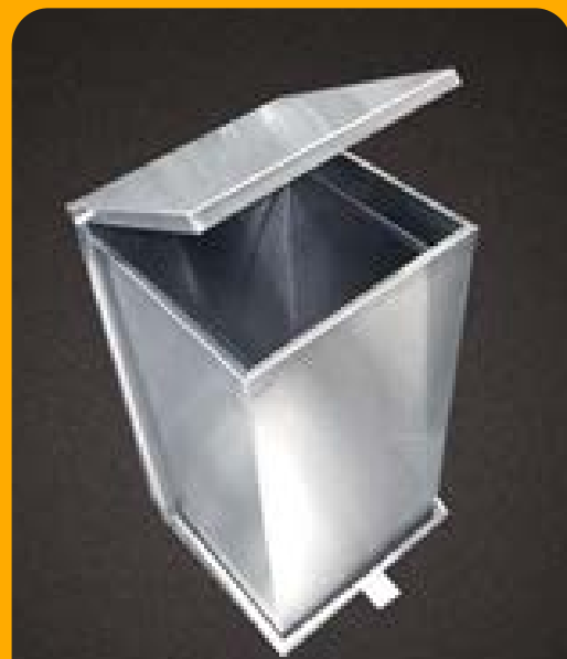
Bote de basura

Manufactura sanitaria con acabado satinado. Fabricación en acero inoxidable para una limpieza fácil, rodajas totalmente sanitarias y lámina antiderrapante.