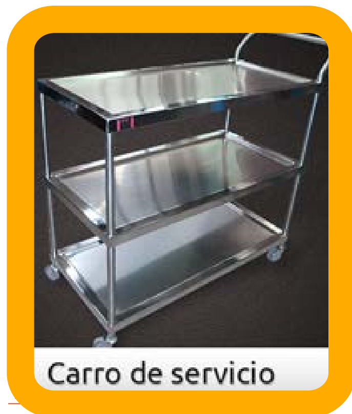
Carro de servicio

Manufactura sanitaria con acabado satinado. Fabricación en acero inoxidable con diseño para fácil limpieza y entrepaño de lámina de acero inoxidable (opcional).